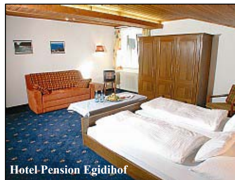
Hotel Pension Egidihof