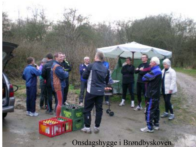
Onsdagshygge i Brøndbyskoven