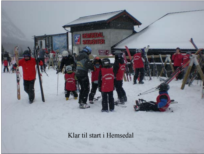
Klar til start i Hemsedal

Der tages forbehold for valutasingninger, prisstigninger på olie, færgebilletter, vej-skat m.m.