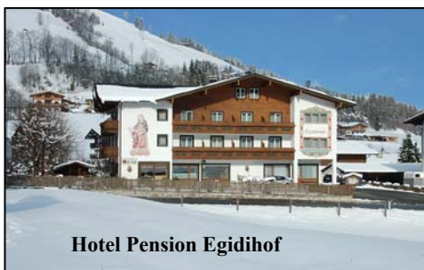
Hotel Pension Egidihof

Tidlig aftensmad ved afrejse, i lighed med sidste år, € 12,50 per voksen og € 7,00 per