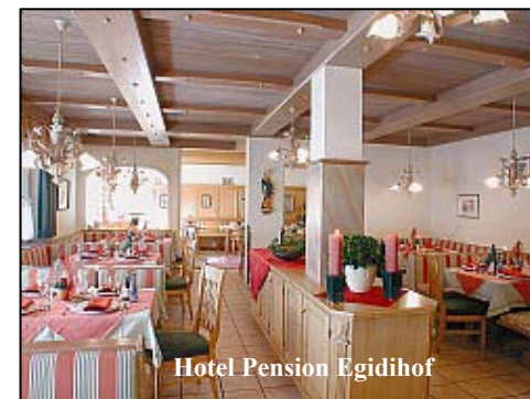
Hotel Pension Egidihof