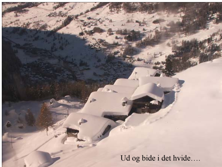
Ud og bide i det hvide....